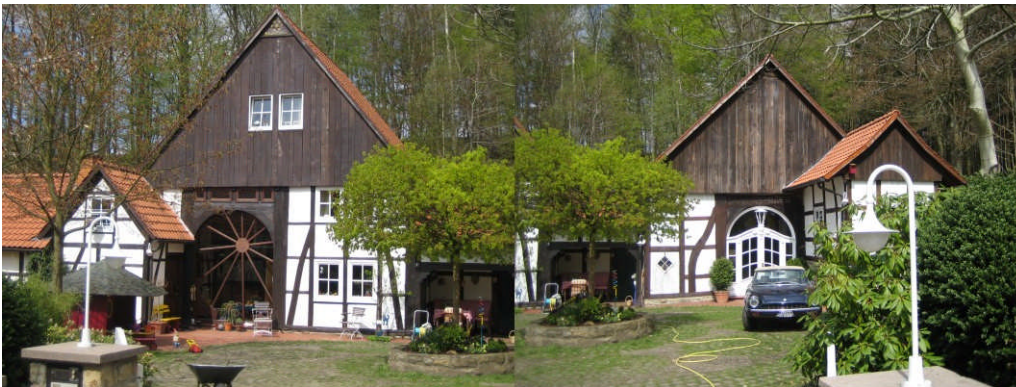
Bild: Hof Beckmann 2006 Links Haupthaus Rechts Leibzucht